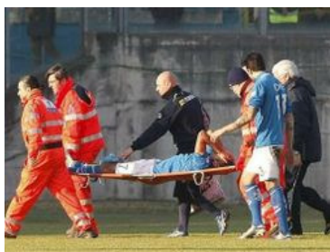
I volontari di Bresciasoccorso in azione allo stadio Rigamonti